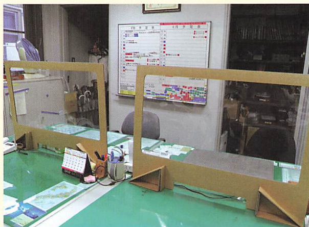
事務室にも飛沫防止パネルを設置