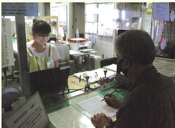
窓口もビニールシートでコロナ対策