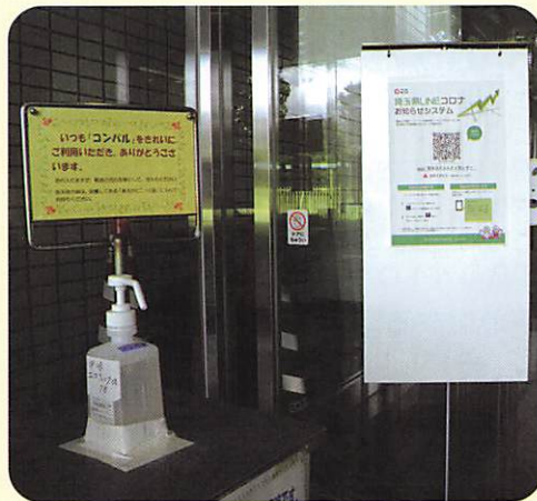
玄関には消毒液を設置

さらに、コロナ対策に配慮しながら講座等の事業も再開しています。コンパルは、こうした状況下でも地域コミュニティの場として活動していますので、皆さんも気軽に足を運んでください。