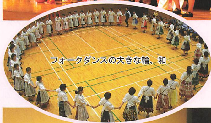
フォークダンスの大きな輪、和