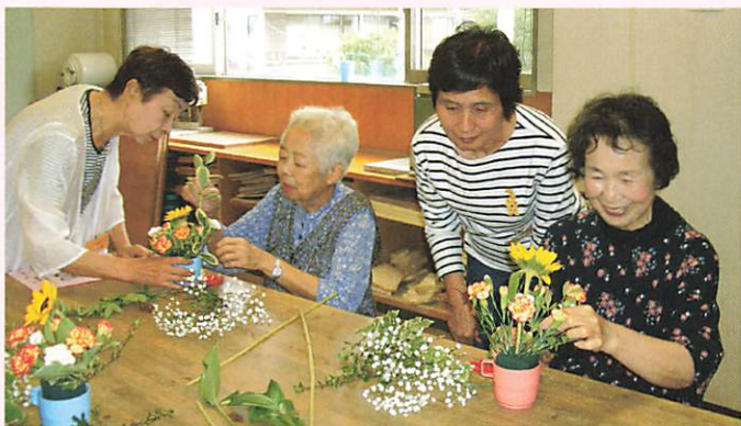
フラワーアレンジメントを体験