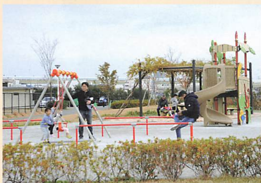
概ね3~6歳を対象とした遊具を配置