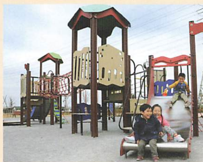
概ね6~12歳を対象とした広場 大型のアスレチック遊具を多数配置